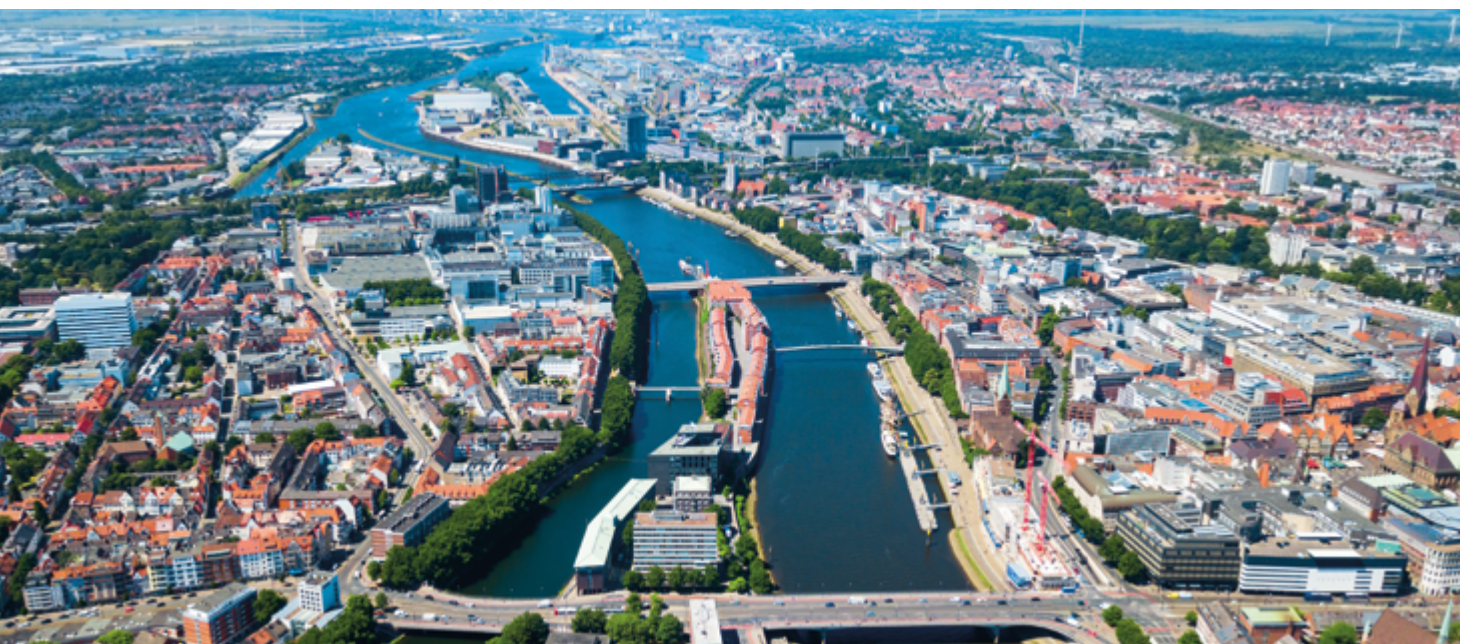
Bürogebäude der HTB Group in Bremen und Luftaufnahme der Bremer Innenstadt, im Hintergrund der Stadtteil Überseestadt (Sitz der HTB Group)